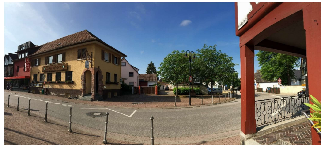
Potenzialfläche Marktplatz 6-12, Quelle: NH ProjektStadt

Auszug aus ISEK (Integriertes Städtebauliches Entwicklungskonzept) bzw. IHK (Integriertes Handlungskonzept) nebst Angabe der Maßnahmennummer sowie Seiten-angabe